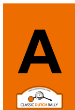
Routecontrole - Zelfschrijver -