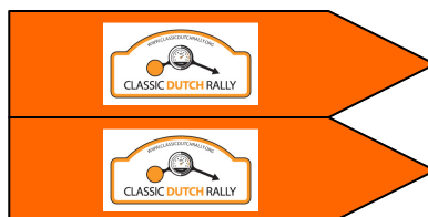
Twee dwangpijlen Bij het einde van de te volgen omleiding